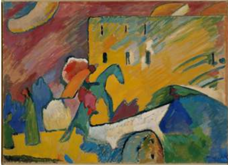
Vassily Kandinsky (1866-1944) « Improvisation III », 1909 Huile sur toile, 94 x 130 cm. Paris, musée national d'Art moderne - Centre Georges Pompidou